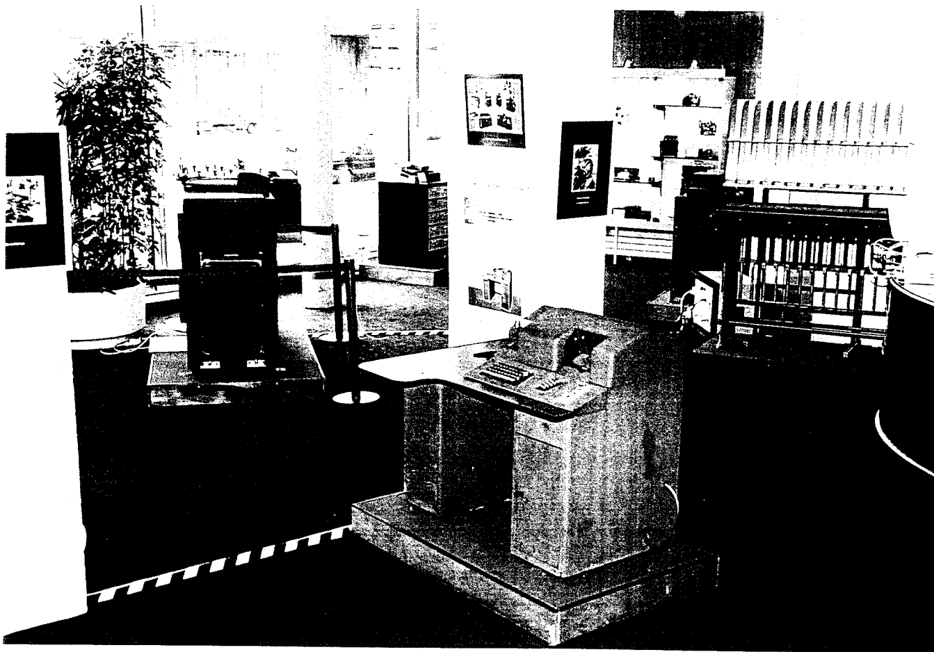
vue partielle de l'exposition de Bobigny

Que veut dire ce titre ! Tout simplement pour reprendre notre principal sujet "l'exposition de Bobigny", cette exposition si géniale que vous regrettez tous de n'avoir pu lui rendre visite. Mais eux, les enfants en âge scolaire, de la classe de 5 ème à la 3 ème , des différents collèges que compte le département, sont venus à tour de rôle avec leurs enseignants. La plupart venaient sur l'initiative d'une opération réalisée par le Conseil Général de la Seine-Saint-Denis, Citoyenneté Jeunesse et l'Inspection Académique de la Seine-Saint-Denis, sur le sujet général "Passport pour construire notre 21 ème siècle" .