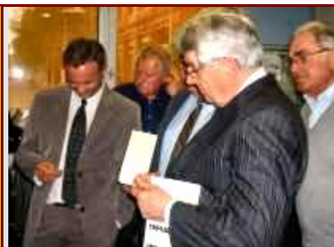
- Visite du Musée de la Mécanographie à Belfort -